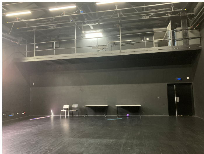
Vue à partir du fond de scène / le gradin prend place sous la passerelle régie / vue de la porte entrée public

Dimension de la salle sans gradin : 12 m / 11,78 m