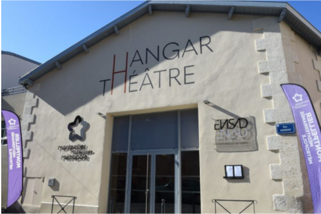
Hangar Théâtre / 3 rue Nozeran 34090 Montpellier