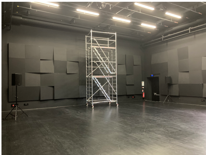
Vue à partir de la porte entrée public sur le mur du lointain de la salle, porte sortie secours donnant dans la rue