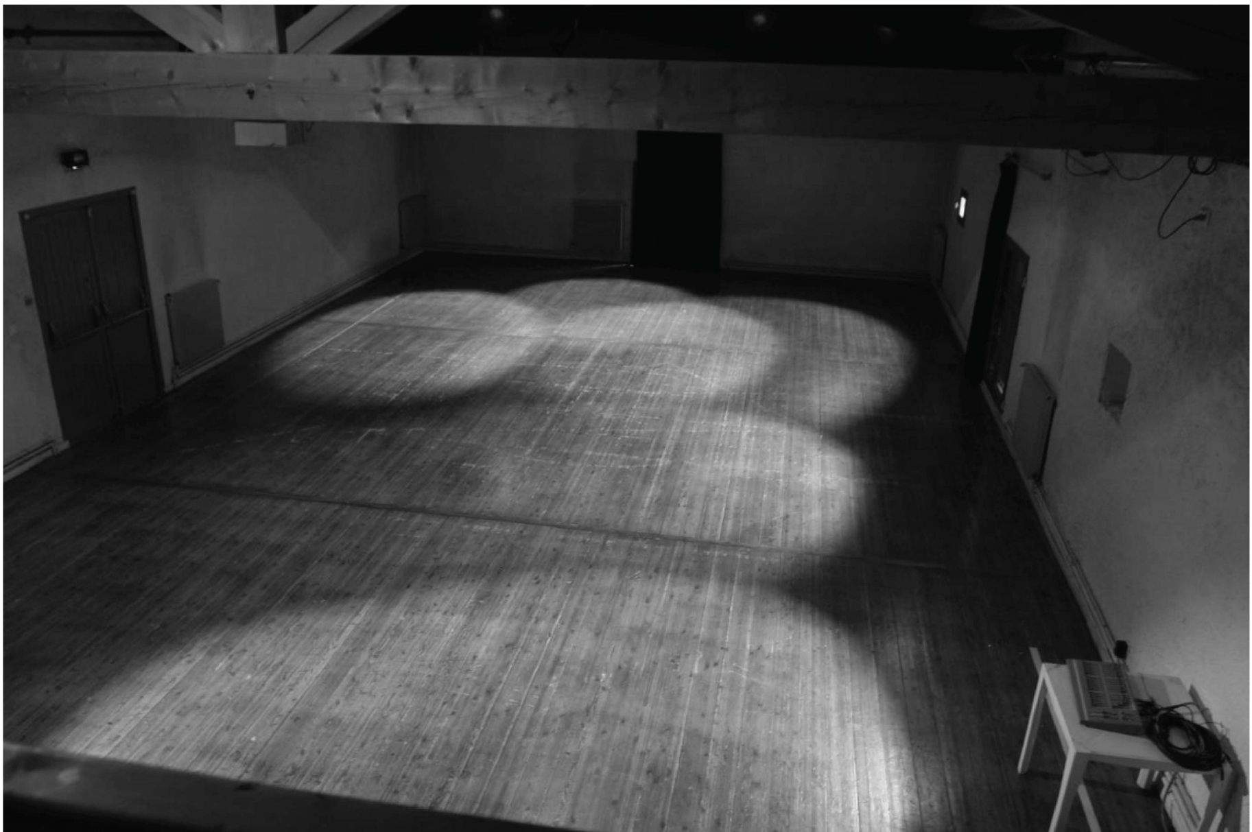
Sans gradin vue de la régie