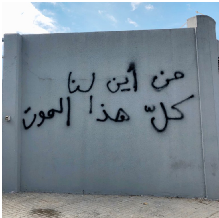
« D'où nous vient toute cette mort ? », graffitis, Beyrouth

Dans Sur Racine , Roland Barthes propose cette définition du héros tragique : « Il est celui qui ne peut sortir sans mourir ». Cette définition résonne bizarrement avec l'un des graffitis de mon quartier à Beyrouth : « D'où nous vient toute cette mort ? ». Sommes-nous, alors habitants de cette ville, des héros tragiques en quête désespérée d'une issue, d'où cette « mort » qui nous vient de partout ? Je ne sais pas, j'essaie de me raisonner, de ne pas me sentir coupable, de me dire que je n'ai rien fait, de me convaincre que moi aussi je suis une héroïne tragique qui suis déjà morte. Mais ce statut d'héroïne, est-il réservé pour une femme comme moi - une artiste se voulant marginale mais qui appartient aujourd'hui à la caste de la bourgeoisie culturelle ? Est-il réservé pour une femme de ma génération ? Est-il réservé pour une femme tout court ? Je ne sais pas, tout ce que je sais c'est que souvent je me sens coupable parce que j'ai des désirs d'avenir. Puis, je me sens impuissante parce que je n'ai aucune réponse à cette question : « D'où nous vient toute cette mort ? ».